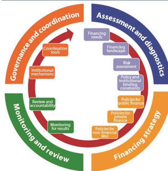
Figure 3 Building blocks of an INFF